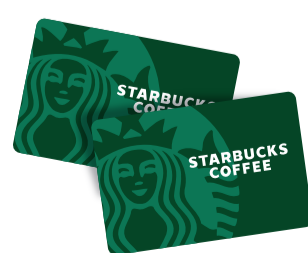
기념품 - 스타벅스 커피 기프트카드 (5,000원 상당)